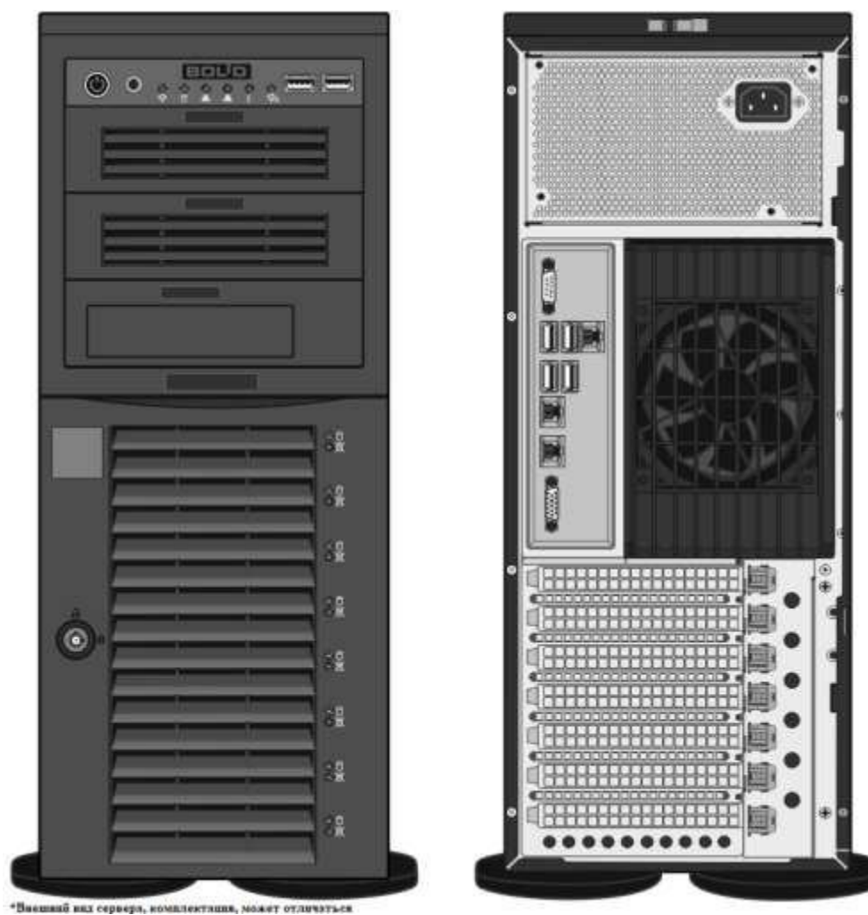
Рисунок 1. Конструкция системного блока*.

2.3 Конструкция системного блока представлена на рис.1: