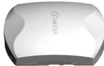
Рисунок 1. Внешний вид прибора

Прибор изготовлен в пластмассовом корпусе (рисунок 1).