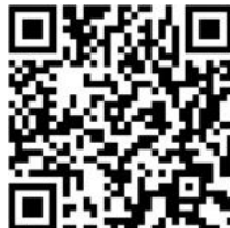
Прошивки и утилиты